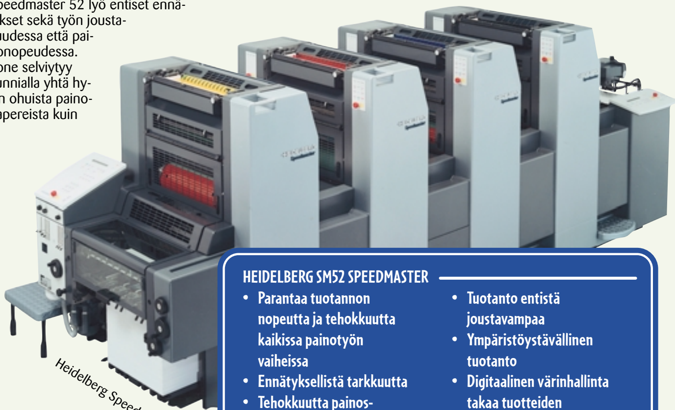
Heidelberg Speedmaster 52

SM 52:llamme on tärkeä tehtävä etenkin mainospainotöissä. Nämä painotuotteet ovat moniosaisia kokonaisuuksia saatekirjeineen, vastauskortteineen ja kuorineen, joten ne sopivat erikoisen hyvin tälle koneelle. Muita esimerkkejä ovat käyntikortit, yritysten lomakkeistot, kutsut, folderit, esitteet ja lehdet. Työt ovat usein laadullisesti erittäin vaativia töitä. Me liikekirjapainolaiset pidämme haasteellisista painotöistä. Toivomme, että pistätte meidät ja uudet laitteemme koville!